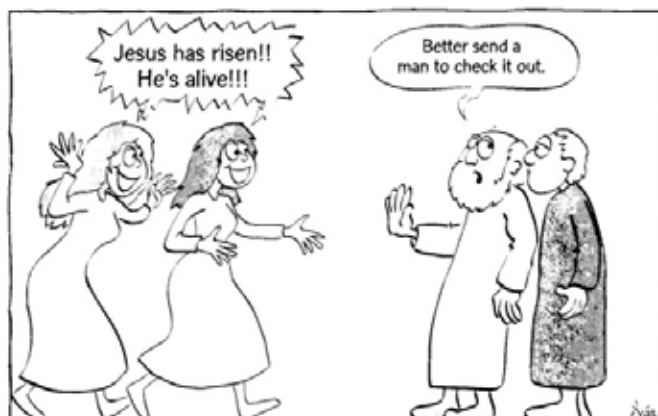
Some of our companions went to the tomb and found everything exactly as the women had reported, but of him they saw nothing. Luke 24, 24