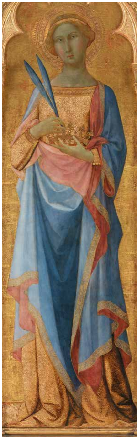
Sta Corona, skytshelgen mot pest. Del av altertavle fra Siena, 14. århundre, Statens Museum for Kunst, København