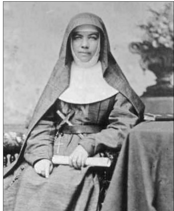
EKKOMMUNISERT OG HELLIGKÅRET: Sr. Mary MacKillop (1842-1909) var med og grunnla kongregasjonen Søstre av St. Josef av Jesu hellige Hjerter i 1866 i Australia. Ordenen la ned mye arbeide i skolevesenet.

ahu, America The National Catholic Weekly