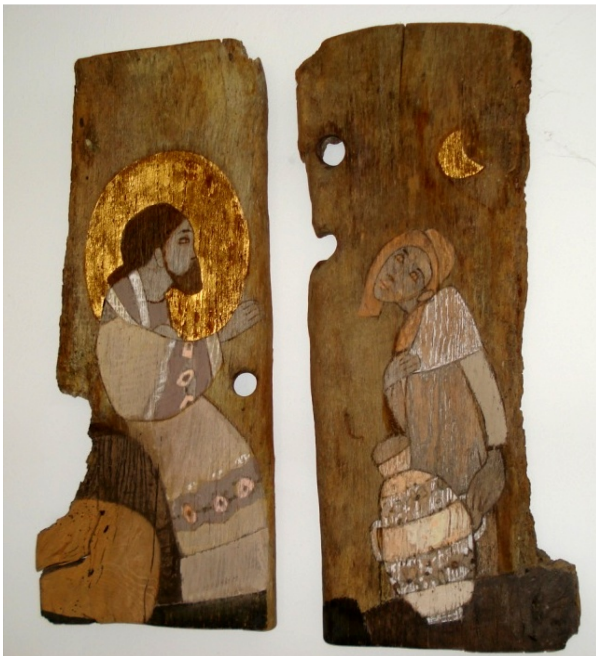
KUNST I EN AV SPISESALENE: Jesus og kvinnen ved brønnen.