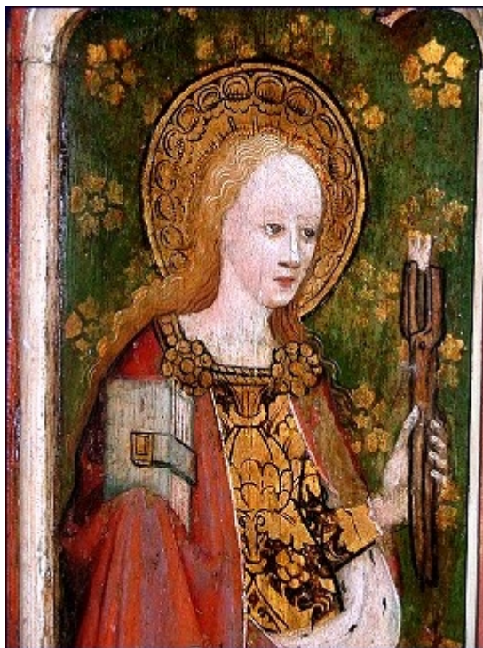
DIAKON PÅ 200-TALLET: St Apollonia av Alexandria er en av kirkens tidlige diakonisser, se blant annet katolsk.no. At hun ofte avbildes med en tang for tanntrekking har sin bakgrunn i hennes martyrdød, der hun fikk alle tennene slått ut.

Det er derfor naturlig å oppfordre biskopen til å opprette en arbeidsgruppe som kan a. oppsummere det teologiske grunnlaget for kvinnelige diakoner, og b. undersøke hvilke arbeidsoppgaver det vil være naturlig og hensiktsmessig å gi kvinnelige diakoner i vår norske, eller eventuelt nordiske kontekst. Og så må man få tillatelse fra paven til å sette i gang. Ingen har prøvd det enda. Noen må være de første.