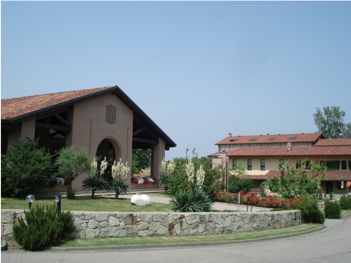
GJESTFRITT OG VARMT: Brødrene og søstrene er uhytidelige, og de viser ekte interesse for mennesker som kommer utenfra. Kirken i Bose til venstre, gjestehus til høyre.