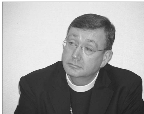
BISKOP BERT EIDSVIG: - Forandringer må bety forbedringer.

En sammenblanding av ideologi / politikk og teologi kan innebære en fare. Hva beslutninger